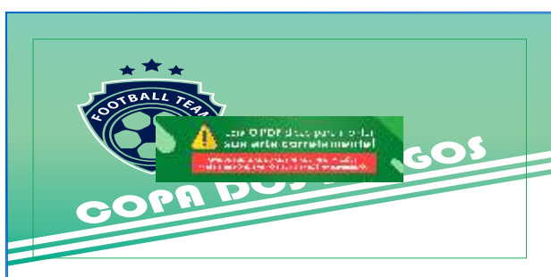
Página 01 Impressão